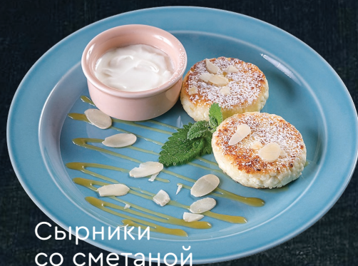
Сырники со сметаной