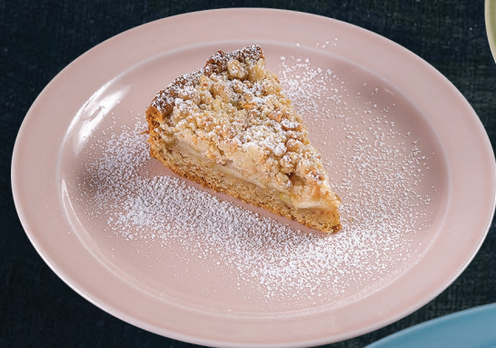
Орехово- яблочный пирог