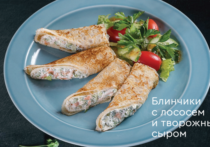
Блинчики с лососем и творожным сыром