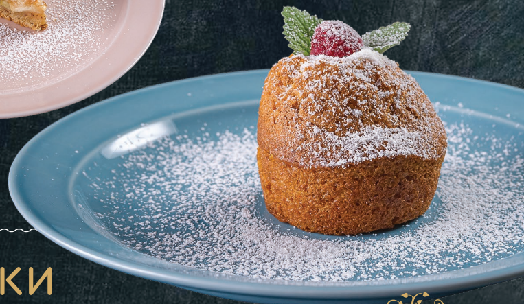
Морковный маффин со сметанным кремом