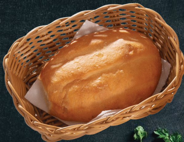
Матнакаш подается к глазунье или омлету