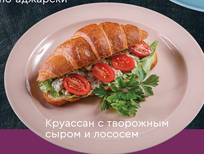
Круассан с творожным сыром и лососем