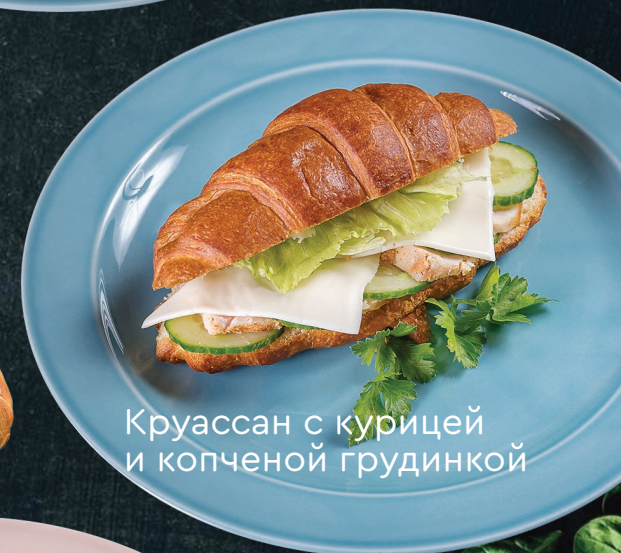
Круассан с курицей и копченой грудкой