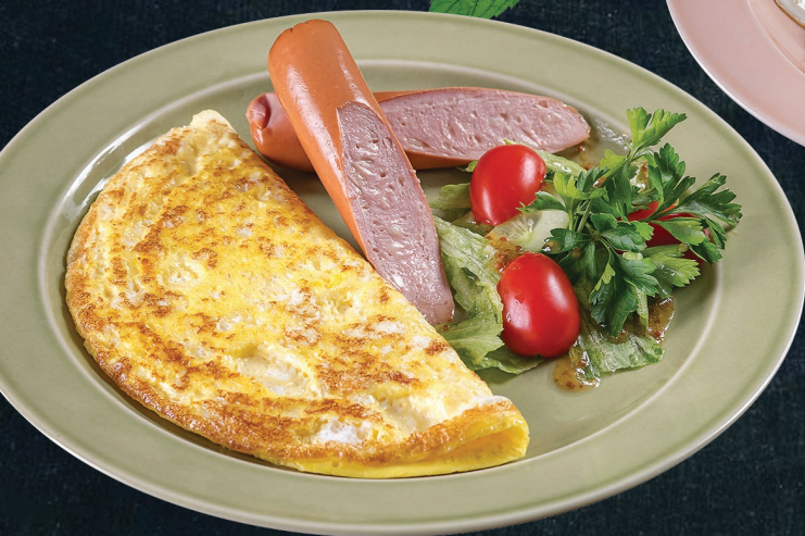
Омлет с сосиской или беконом